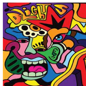
ALBUM STUDIO SORTIE LE 28 AOUT 2015